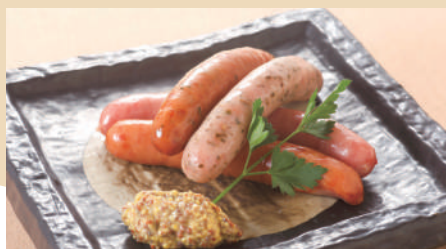
道産4種のソーセージ盛り合わせ