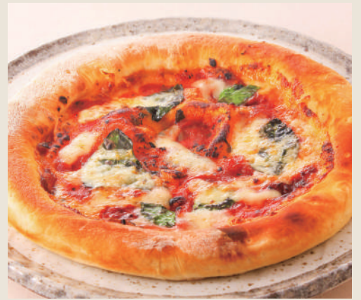
耳までチーズのマルゲリータ ¥980(税込)