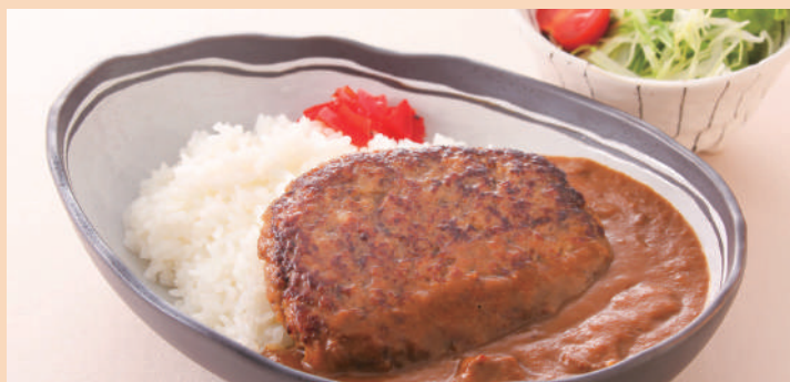
ハンバーグカレー ミニサラダ付き ¥980(税込)