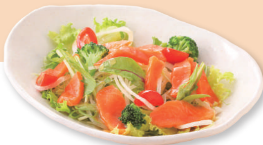
スモークサーモンと季節の和風サラダ ¥940(税込)