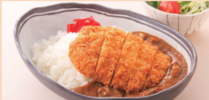
こだわりカツカレー ミニサラダ付き ¥1,200(税込)