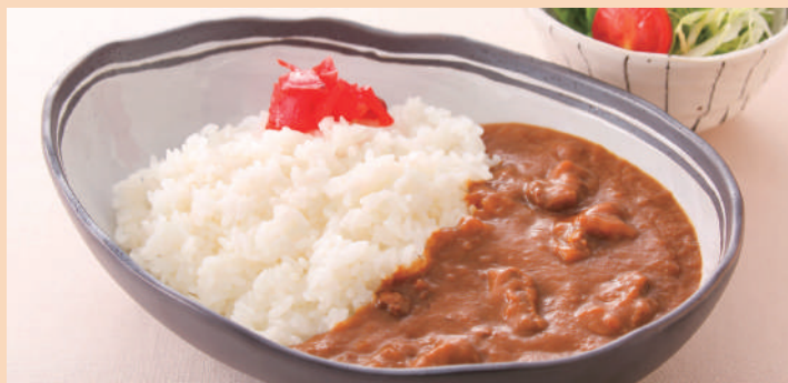
ビーフカレー ミニサラダ付き ¥680(税込)