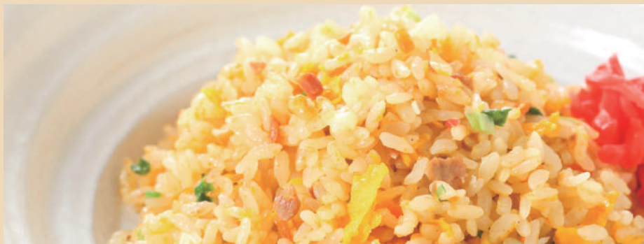
本格炒めチャーハン ミニサラダ付き ¥630(税込)