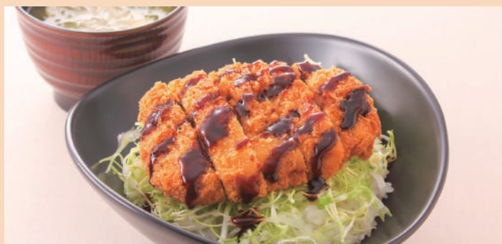
こだわりソースカツ丼 ふのりと豆腐のお味噌汁付き ¥980(税込)