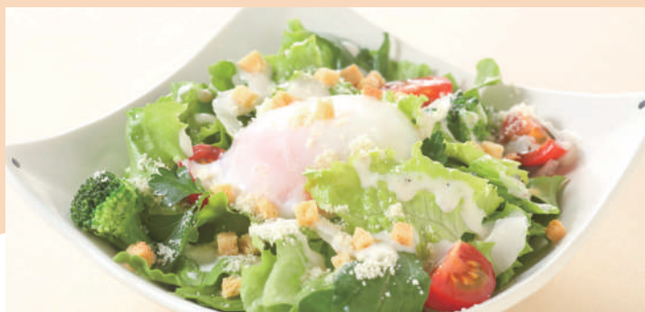
温玉シーザーサラダ ¥780(税込)