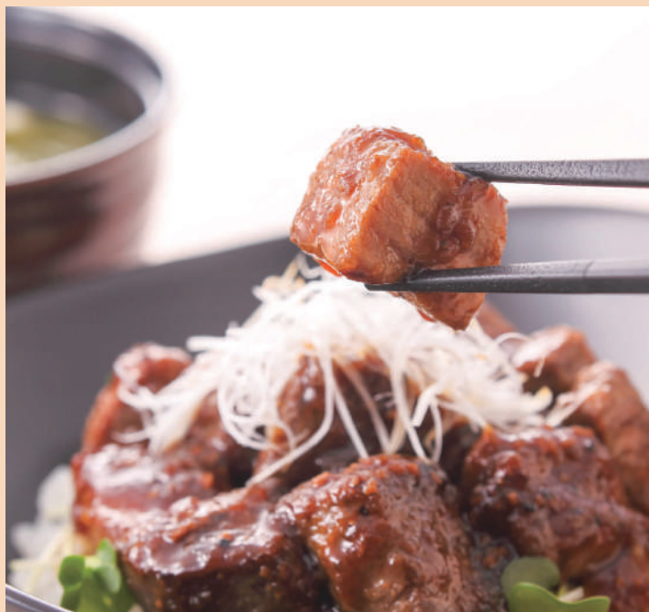
スタミナ牛カットステーキ丼 ふのりと豆腐のお味噌汁付き ¥1,100(税込)