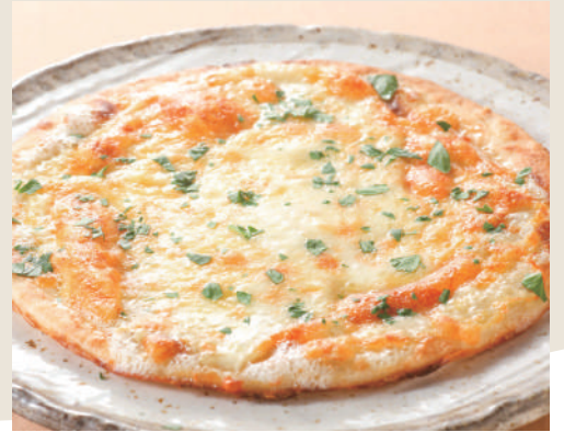
ミラノ風4種のチーズピッツァ ¥880(税込)