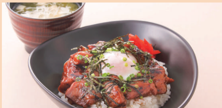
炭火焼き鳥丼温玉のせ ふのりと豆腐のお味噌汁付き ¥880(税込)