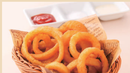
さくさくオニオンリング