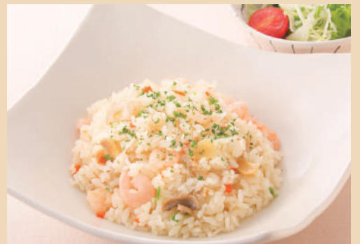
エビピラフ ミニサラダ付き ¥630(税込)