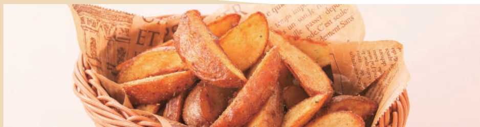
北海道産 皮付きポテト