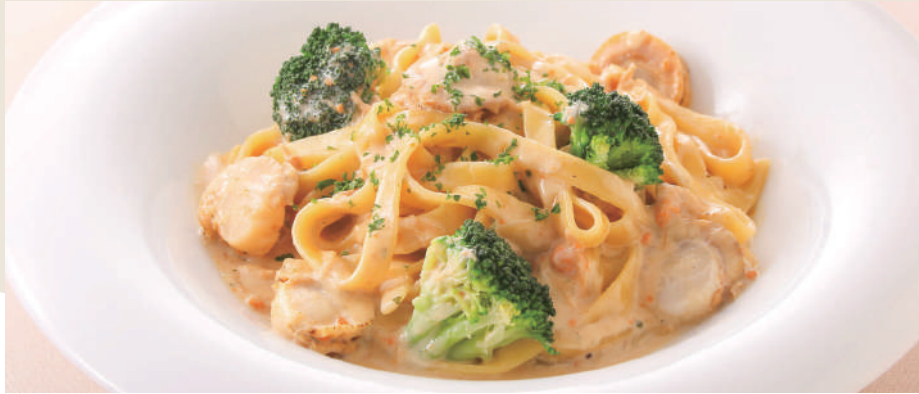
道産帆立のクリームパスタ ミニサラダ付き ¥1,080(税込)