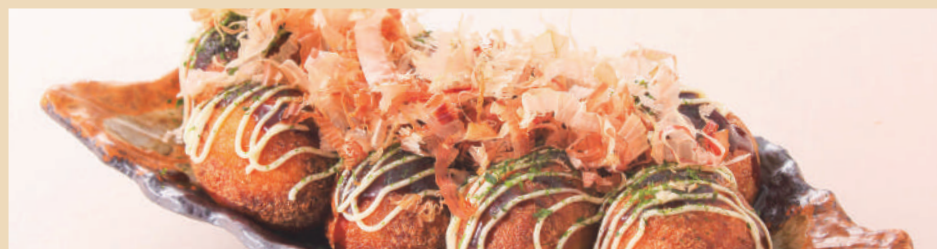
とろ〜り大粒揚げたこ焼き