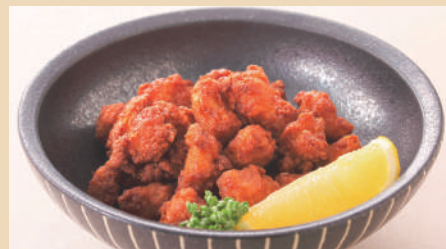
鶏なんこつ唐揚げ