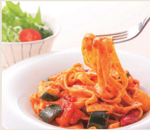
フィットチーネのアラビアータ ミニサラダ付き ¥880(税込)