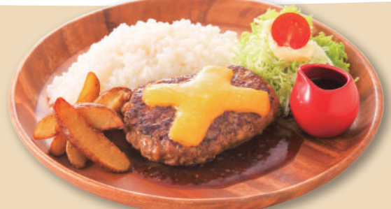
チーズバーグプレート ハンバーグ160g ¥950(税込)