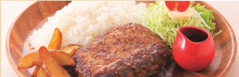
ハンバーグプレート ハンバーグ160g ¥880(税込)